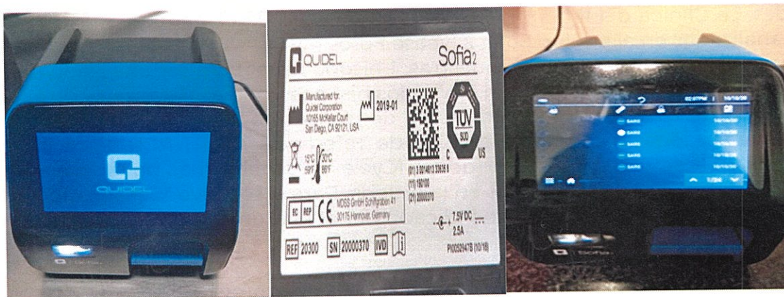
Fotos 4 y 5. Equipo Sofia2

La muestra del paciente se coloca en el tubo de reactivo, durante el cual las partículas del virus de la muestra se rompen, exponiendo las nucleoproteínas virales internas. Después de romperse, la muestra se dispensa en el pozo de muestras del cassette de prueba. Desde el pozo de muestra, la muestra migra a través de una tira de prueba que contiene varios ambientes químicos únicos. Sí el antígeno viral del SARS-CoV o del SARS-CoV-2 está presente, quedarán atrapados en un lugar específico.