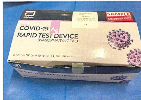
Fotos 1, 2 y 3. Estuche de Diagnóstico "Panbio™ COVID-19 Ag Rapid Test Device"

Los resultados obtenidos se muestran a continuación.